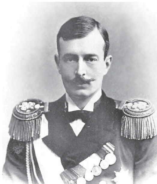
Великий князь Кирилл Владимирович (фото начала 1900-х гг.).