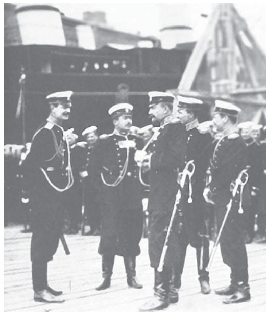
Великий князь Кирилл Владимирович (стоит слева) с офицерами Гвардейского экипажа.

В мае 1896 г. «Высочайшим приказом по флоту» гардемарин унтер-офицер Кирилл Владимирович производится в мичмана и назначается в Гвардейский экипаж «состоять флигель-адъютантом Его Императорского Величества». Первый год службы проходит «в роте Ея Величества» — строевые занятия с новобранцами, смотры, разводы, дворцовые караулы и т.д. Однако уже в мае 1897 г. молодой моряк уходит в свое первое дальнее плавание. Крейсер «Россия» направлялся в Тихий океан. Вахтенным офицером на нем шел мичман К. Романов. Плавание через Средиземное море и два океана продолжалось более девяти месяцев. В вахтенном журнале крейсера за четкой подписью «В.К. Кирилл Владимирович» можно прочитать многочисленные записи вахт великого князя. Все они будничны и лаконичны. «12 февраля. 5 ч. Разбудили команду, дали завтракать. 6 ч. Начали мытье шлюпок и принадлежностей. 6 ч. 50 м. Начали разводить пары на катере № 1. 7 ч. Спустили шестерку № 1» 2 . «13 февраля. Стоим на Гонконгском рейде. Якорного каната на правом клюзе 67 саж. 1 ч. Развели огонь в камбузе» 3 . «15 февраля 8 ч. 25 м. Прекратили пары на катере № 1. Сего числа привезено провизии: мяса — 16 пуд., хлеба — 50 пуд., зелени — 8 пуд. Выброшено за борт негодной соленой капусты — 3 пуд» 4 . И так в течение всего плавания. Впрочем, какие еще могли быть заботы у вахтенного офицера на якоре? Даже если он — великий князь.