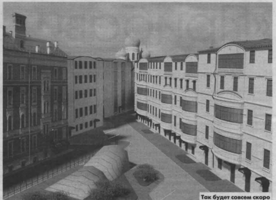
Так будет совсем скоро

— По заказу ГК «СУ-155» компания СК «Подземстройреконструкция» провела всестороннюю экспертизу зданий бывшей казармы Гвардейского экипажа на пр. Римского-Корсакова 22/133. В процессе было выяснено, что исторический квартал, застройка которого началась в конце XVIII века и с пере-