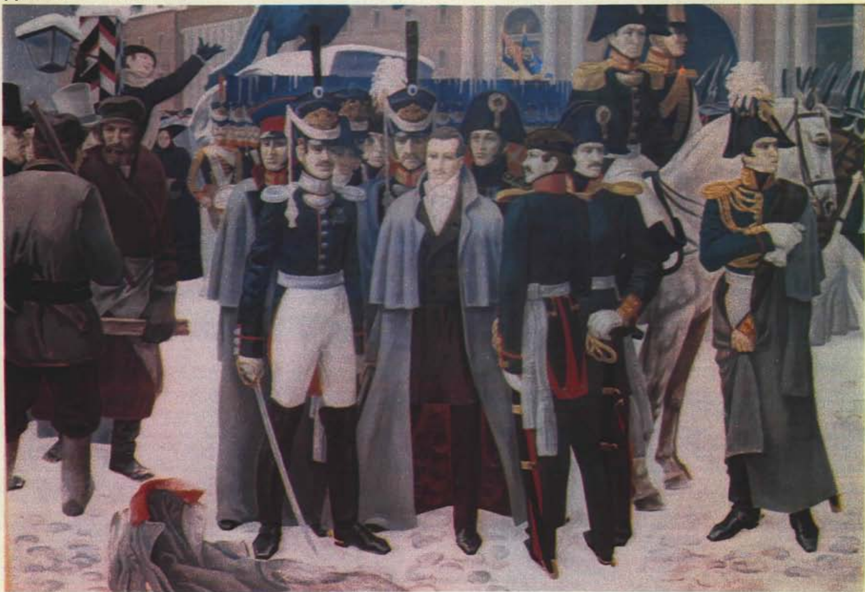
КАРТИНА ВЛАДИМИРА ИСАРЕВА «ДЕКАБРИСТЫ».