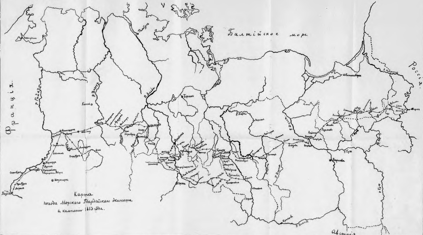
Карта похода Морича Гвардейского Житана в кампании 1813 года.