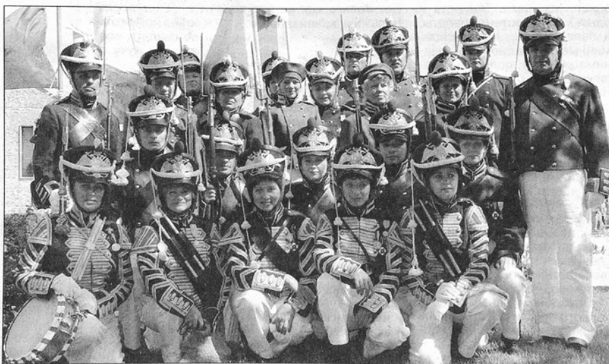
Членов клуба часто приглашают на международные исторические фестивали. Этот кадр был сделан во Франции в 2004 году, на праздновании 190-летия взятия Парижа

Петербургские реконструкторы воссоздали подразделение, в котором служил тот самый «дядя», к которому обращается Михаил Лермонтов в стихотворении «Бородино»