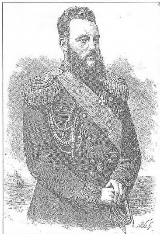
Великий Князь контр-адмирал Алексей Александрович (1878 г.)

Звание Генерал-Адмирала в России ввел Петр I. Первым Генерал-Адмиралом в 1708 г. стал граф Ф.М.Апраксин. В 1762 г. генерал-адмиральский чин Екатерина II пожаловала своему сыну, 8-летнему царевичу Павлу Петровичу. С этого времени Генерал-Адмиралами становятся только представители царствующей династии. Так, в 1881 г., сменив своего дядю, крупнейшего реформатора отечественного флота Велико-