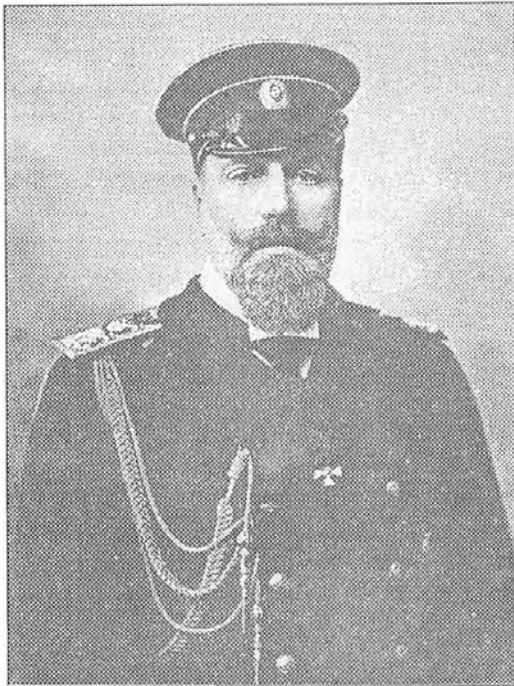
Великий Князь Генерал-Адмирал Алексей Александрович (1901).

— императорские яхты. Правда, были еще и заседания Кораблестроительного и Адмиралтейского отделов Морского Технического Комитета, а также Коллегии Николаевской морской академии, членом которых являлся Великий Князь, но они его не увлекали.